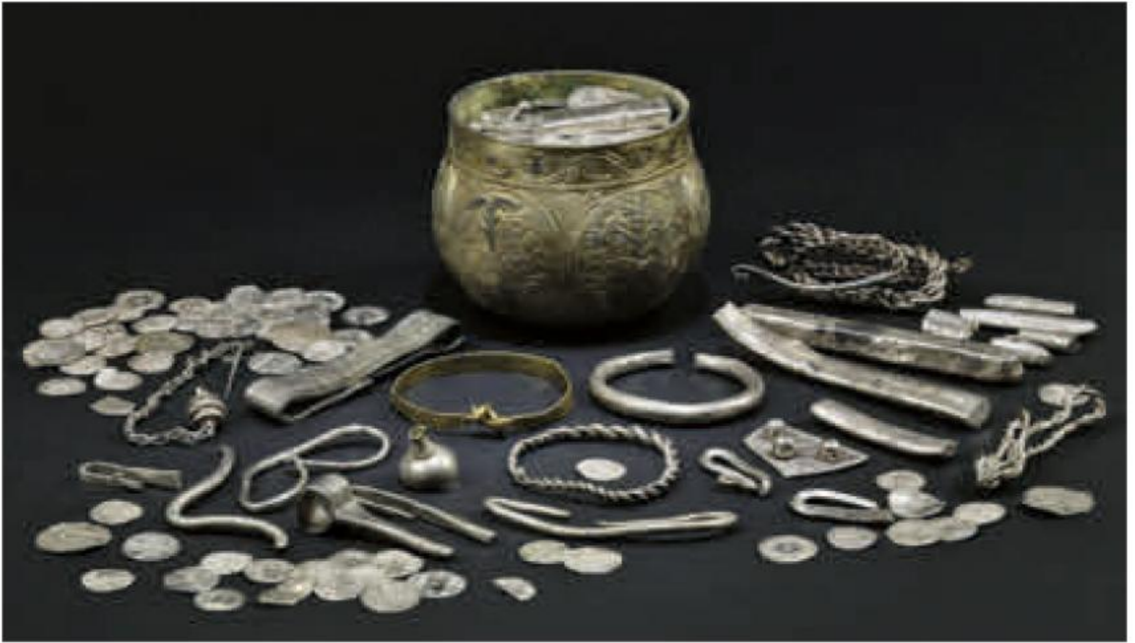
Der Schatz von Vale of York (10. Jahrhundert) wurde 2007 von Sondengängern entdeckt.