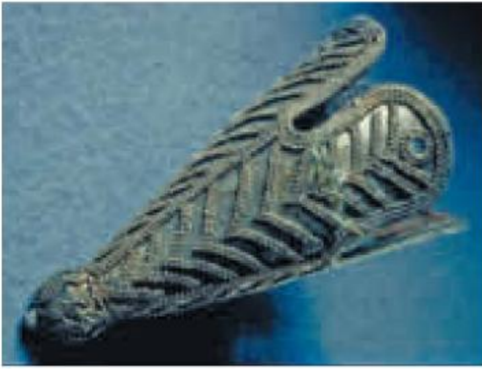
Silberne Mützenspitze aus Grab 581 in Birka.