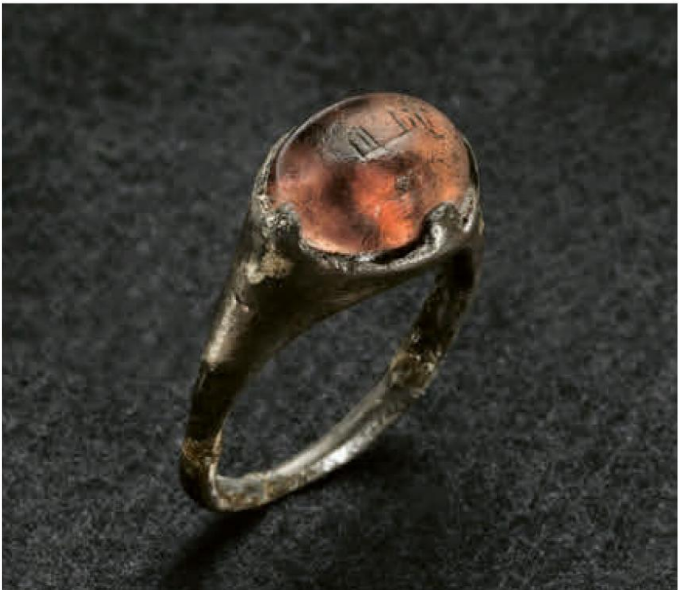
Ring mit kufischer Inschrift aus einem Frauengrab in Birka.