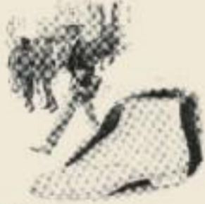
After all the other shoes you have worn, you will find Keds are the only shoes that are light and comfortable. You will look to the next Keds on the shelf.

Always wear the Keds and you will find them to be the only shoes that are light and comfortable. You will look to the next Keds on the shelf.