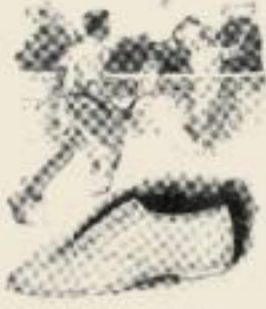
The Keds shoe is the only shoe with a rubber sole. It is light, comfortable and durable.

For men and women, 75 cents to $1.00. For children, 50 cents to $1.00.