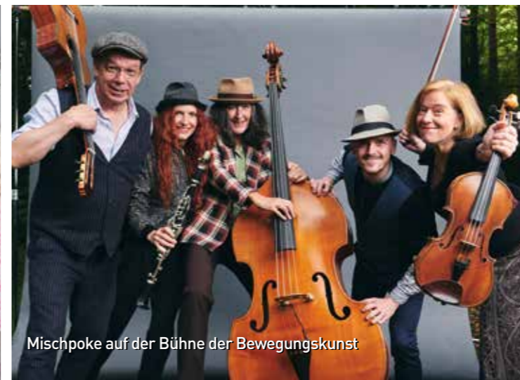
Mischpoke auf der Bühne der Bewegungskunst