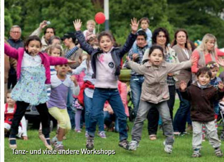
Tanz- und viele andere Workshops