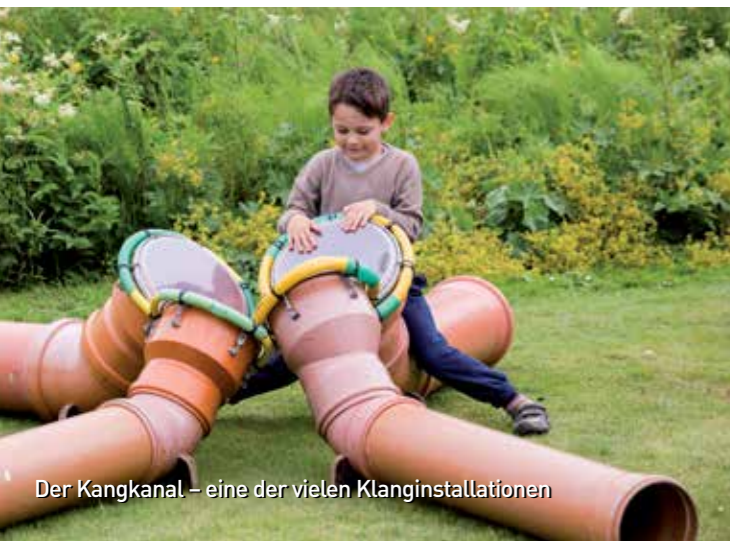
Der Kangkanal – eine der vielen Klanginstallationen

Fotos: Richard Stöhr, Bernd Seuffert · Illustrationen: Andreas Röckener