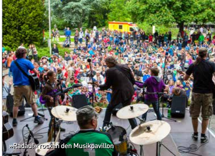
»Radau!« rocken den Musikpavillon