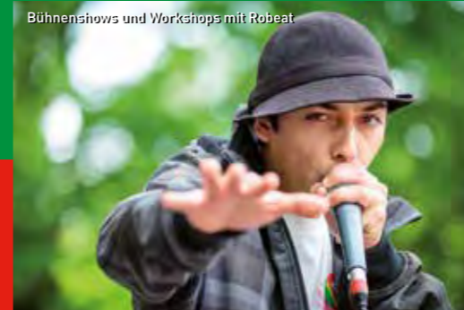
Bühnenshows und Workshops mit Robeat