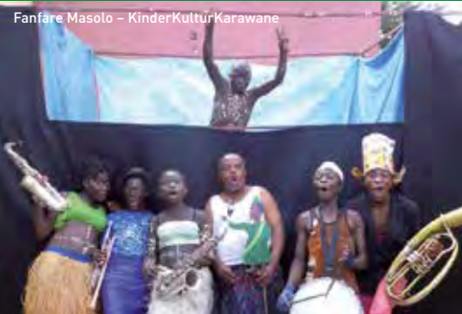
Fanfare Masolo – KinderKulturKarawane